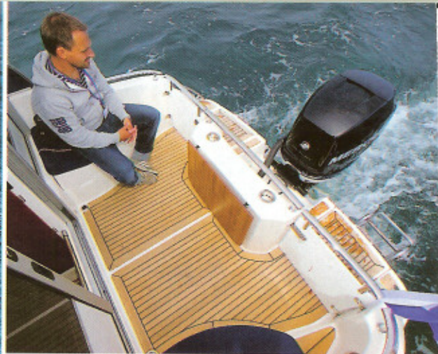
▲ AKTERDÄCK HAR ett uppvikbart bord och plats för två. Här trivs jag inte i hög fart.

man kan åka ut på sjön två dagar, även som nyförälskad.