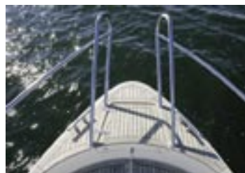
Delad förpulpit gör det lätt att ta sig ombord och iland från fören. Förutom de båda knaparna i fören och aktern finns ytterligare två midskepps som är bra när man vill förtöja med spring.