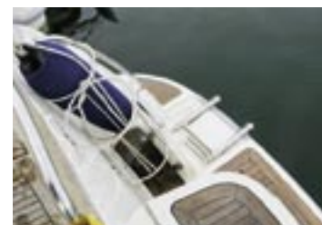
Badstegen är lyckligtvis av den sorten som nås från vattnet. Något som tyvärr inte är självklart på moderna båtar.

men lösningen är då att ta vägen genom någon av sidodörrarna.