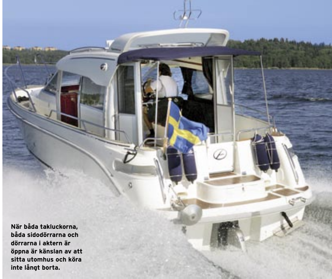
När båda takluckorna, båda sidodörrarna och dörrarna i aktern är öppna är känslan av att sitta utomhus och köra inte långt borta.

Sedan fann testlaget heller aldrig någon anledning att stänga luckan efter att man hade gått till sängs på kvällarna. I öppet läge blockerar luckan visserligen dörren som leder ut till akterdäcket