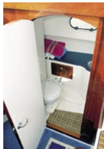
Toalettutrymme med dränerad durk, handfat och en våtrumsbänk. Handdusch kostar dock 6 500 kronor extra.

inte långt borta. Oavsett var i salongen man befinner sig.