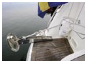
Bra integrerad badbrygga som nås via en dörr i akterspeglin. Elankarspel med fjärrkontroll kan spara ryggen men kostar 52 000 kronor extra.