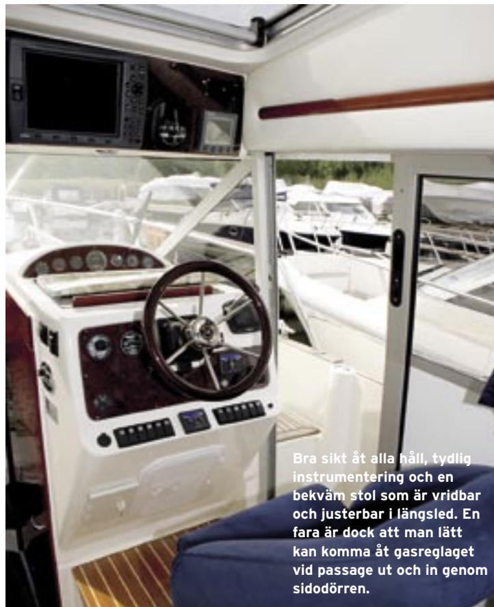
Bra sikt åt alla håll, tydlig instrumentering och en bekväm stol som är vridbar och justerbar i längsled. En fara är dock att man lätt kan komma åt gasreglaget vid passage ut och in genom sidodörren.