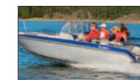
Längd: 5,15 m Bredd: 2,06 m Antal personer: 7 Rek. Motoreffekt: Max 80 hk