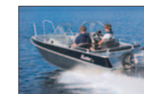
Längd: 5,94 m Bredd: 2,17 m Antal personer: 7 Rek. Motoreffekt: Max 115 hk