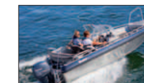
Längd: 5,05 m Bredd: 1,98 m Antal personer: 6 Rek. Motoreffekt Lx: Max 60 hk Rek. Motoreffekt Lx pro: Max 70 hk